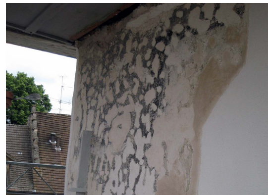
Abb. 3: Zustand der Eckquadermalerei und der Begleitbänder während der Restaurierung.