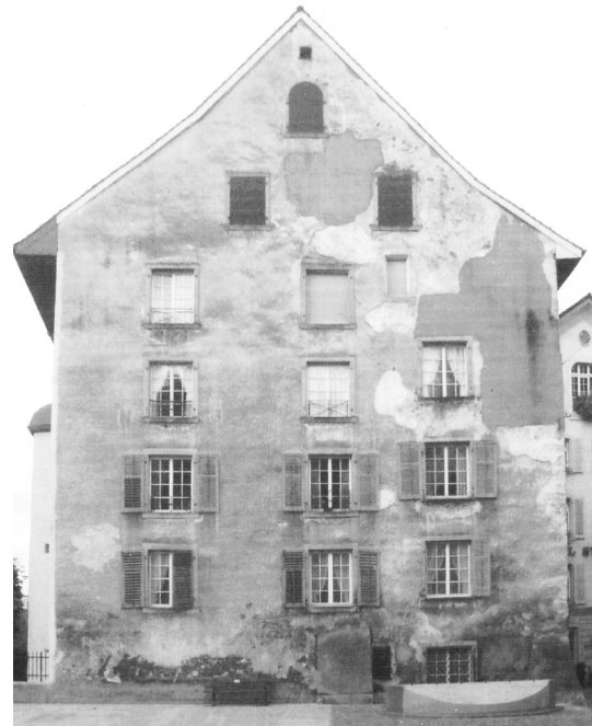
Abb. 1: Nordfassade. Zustand vor der Restaurierung.

Die Wiederherstellung der Fassadengestaltung des 18. Jahrhunderts erfolgte sehr sorgfältig. Die restaurierte Fassade fügt sich gut ins Stadtbild ein. Auf Grund des schlechten Verputzzustandes konnte nur wenig historischer Verputz erhalten werden.