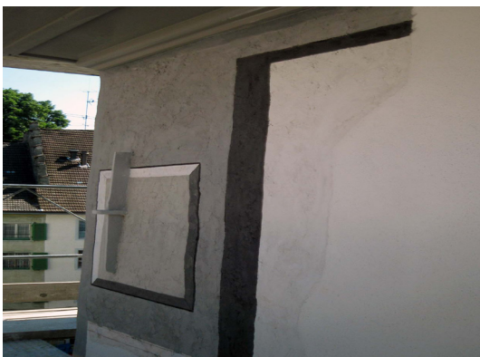
Abb. 6: Zustand der Eckquader und der Begleitbänder nach der Restaurierung.