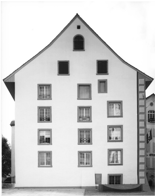
Abb. 4: Nordfassade. Zustand nach der Restaurierung