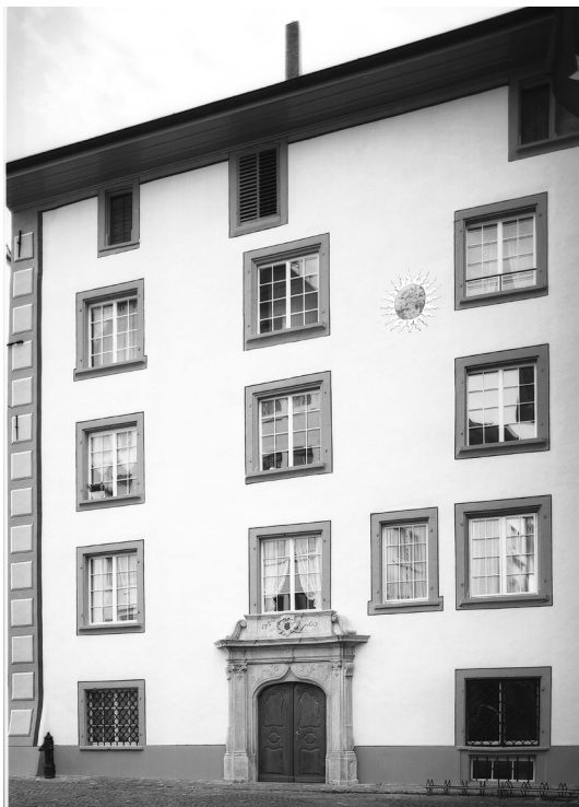
Abb. 5: Westfassade. Zustand nach der Restaurierung