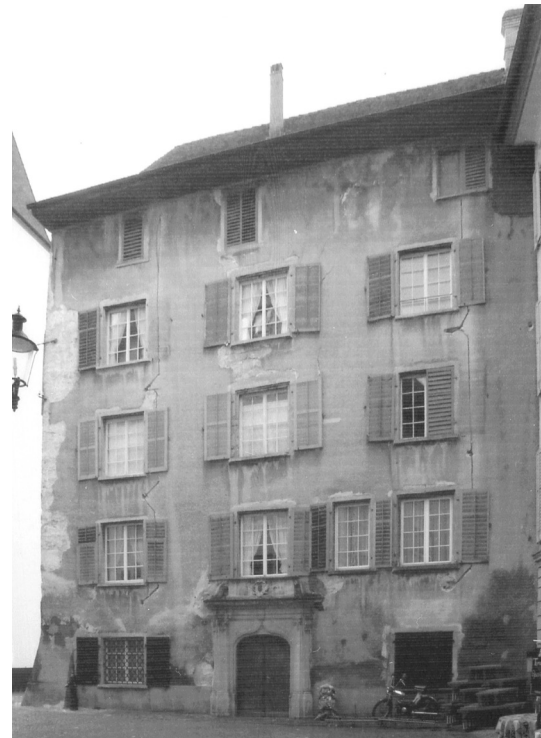
Abb. 2: Westfassade. Zustand vor der Restaurierung