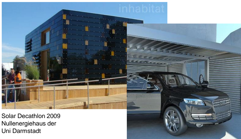
Solar Decathlon 2009 Nullenergiehaus der Uni Darmstadt