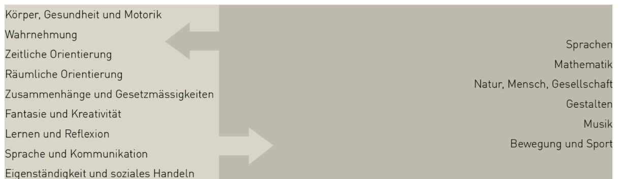
Abbildung 2: Entwicklungsorientierte Zugänge Lehrplan 21

Im Kanton Aargau besuchen alle Kinder den Kindergarten. Die Kinder des 1. und 2. Kindergartenjahres lernen und spielen zusammen in der gleichen Kindergartenabteilung. Der Unterricht wird wie bisher in der Regel auf fünf Vormittage à vier Lektionen und zwei Nachmittage à zwei Lektionen aufgeteilt. Die Kinder werden nach neuem Lehrplan gleich viel Zeit im Kindergarten verbringen wie bisher: Im ersten Kindergartenjahr sind das je nach Klassengrösse 18 bis 22 Lektionen und im zweiten Kindergartenjahr 22 bis 24 Lektionen. Die Planungsannahmen des Lehrplans 21 für den Kindergarten geben für das erste Kindergartenjahr 19 bis 24 Lektionen, für das zweite 24 bis 27 Lektionen vor. Die geringe Differenz zu den Planungsannahmen lässt sich verantworten, da die Empfangs- und Verabschiedungszeiten, die ebenfalls zum Unterricht gehören, nicht als Lektionen eingerechnet sind. Auch in diesen Zeiten wird an Zielen des Lehrplans (siehe Abbildung 2) gearbeitet. Der Kindergarten ist Teil der Volksschule und richtet sich nach den gleichen Bildungszielen wie die Primarschule und die Oberstufe, dies mit einer eigenständigen und entwicklungsorientierten Pädagogik. Der Kindergarten ist Lebens-, Lern-, Entdeckungs- und Erfahrungsraum, wo das Spielen und Verweilen grosse Bedeutung haben. Der Unterricht auf der Kindergartenstufe wird auch zukünftig mit Empfangs- und Verabschiedungszeiten gestaltet.