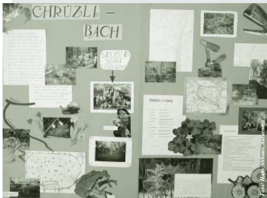
Poster der 5. Klasse aus Rekingen