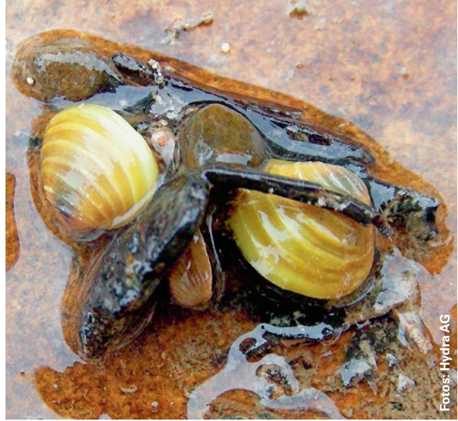
Zwei invasive, gebietsfremde Muschelarten: links die Wandermuschel ( Dreissena polymorpha ), rechts die Asiatische Körbchenmuschel ( Corbicula fluminea )

krebsarten hat im Zusammenspiel mit einem sehr trockenen und heissen Sommer die Wasserinsekten in kurzer Zeit stark dezimiert.