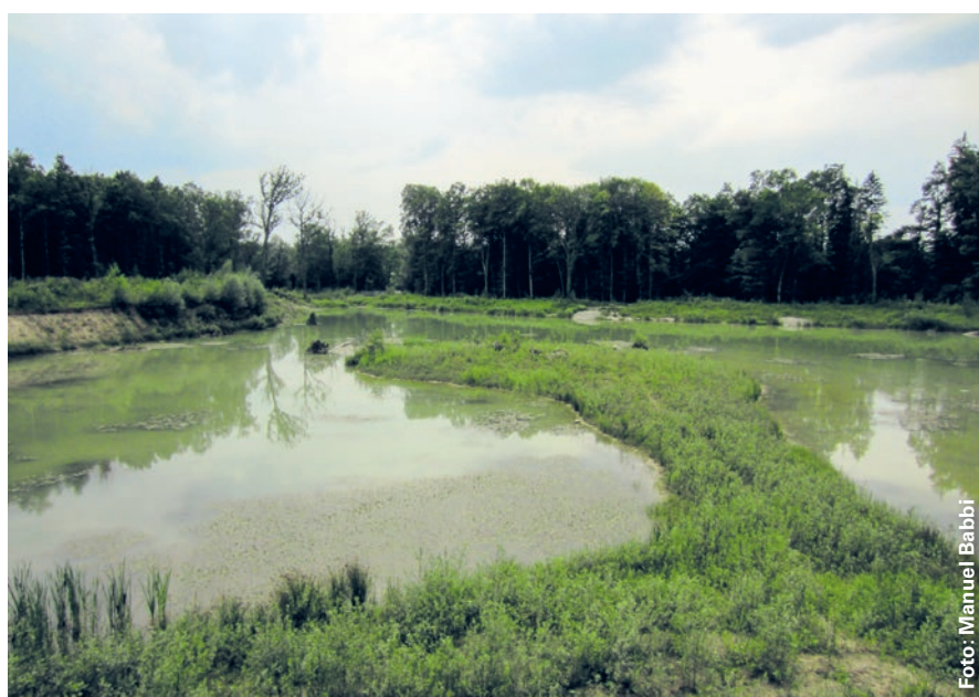
Die Reussschlaufe Hegnau (orange) liegt zwei Kilometer nördlich von Bremgarten. Hier wurde eine neue Auenlandschaft geschaffen (rechts Juli 2015, Blick gegen Südwesten).