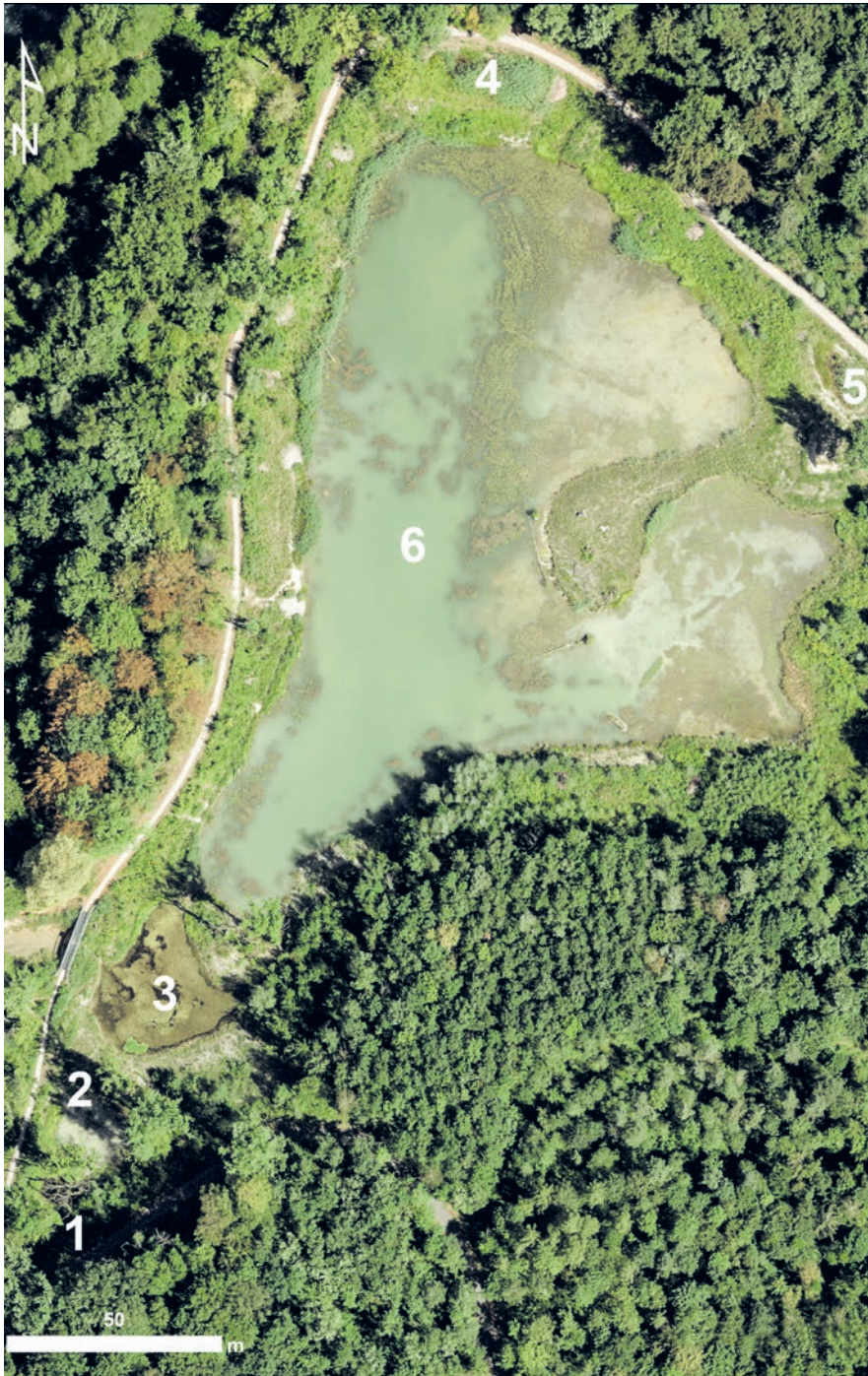
Sechs neue Gewässer wurden in der Reusschleife Hegnau erstellt. Die Gewässer Nr. 3 und Nr. 6 sind bei hohem Wasserstand über einen Einlaufkanal mit der Reuss verbunden. So kann ein gegenseitiger Austausch der Gewässerfauna und -flora stattfinden.