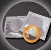
Kondome und vieles mehr ...