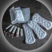
Tampons und Binden