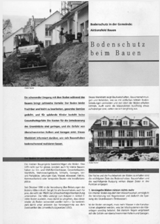
Eines von vier Merkblättern

Viele Fragen rund um die Nutzung des Bodens entscheiden sich im Alltag, insbesondere in den Bereichen Raumplanung, Bauvorhaben, Freizeitgestaltung, Land- und Forstwirtschaft. Gemeinden und ihre Behörden können deshalb einen wesentlichen Beitrag zur langfristigen Erhaltung der Böden leisten. Die Broschüre «Betrifft Boden» sowie vier dazugehörige Merkblätter sind speziell auf die Bedürfnisse der Gemeinden ausgerichtet und zeigen konkrete Massnahmen auf. Die Publikationen wurden gemeinsam durch die Bodenkundliche Gesellschaft Schweiz (BGS) und durch die Stiftung Praktischer Umweltschutz Schweiz (Pusch) realisiert. Die Bodenschutzfachstelle des Kantons Aargau